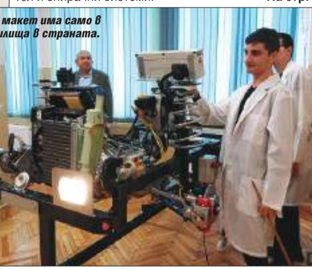
Подобен макет има само в още 4 училища в страната.

ще помогнат на учениците в часовете им по практика. Възпитаниците на гимназията вече разполагат с кабинет за електрообзавеждане на транспортна техника с макети на италианската фирма "Лоренцо". Един от тях представлява макет на реален автомобил с двигател и спирални системи. На стр. 5