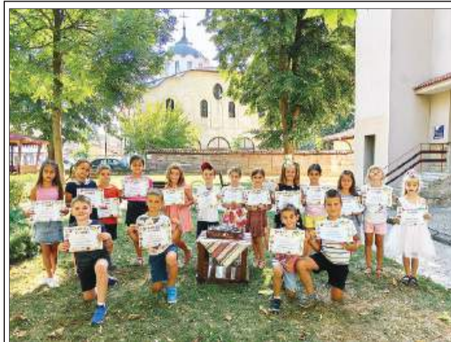
През юни и юли провъзвяха заниманията на бъдещите първокласници в Елена. Общинският център бе огласен от звънките гласчета на децата всеки делничен ден от 8 до 15 часа - малчуганите изучаваха песни и стихчета, навлизаха в тайнствения свят на буквите и цифрите, рисуваха, изрязваха фигурки, моделираха... Не липсваха и разходки, весели игри на двора, както и посещения в уюте училища, които наскоро ще посрещат първолаците. Ползватия и за родителите заниманията отново се организират от Местната комисия за борба срещу противообществените прояви на малолетните и непълнолетните.