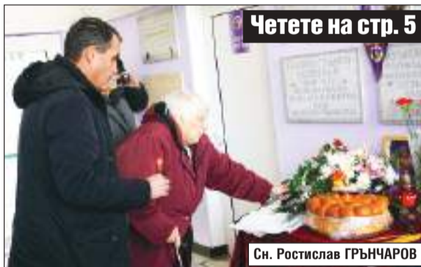
Четете на стр. 5

Старата столица се поклони пред паметта на Трифон Иванов, планират да открият паметника му за 27 юли