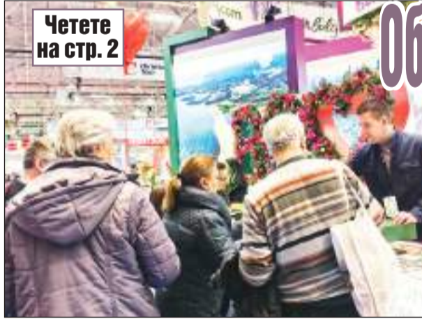
Четете на стр. 2

Община Елена представи туристическия си потенциал в Румъния